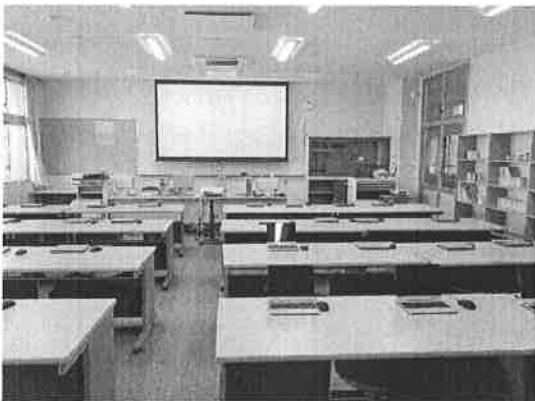
コンピュータ室 【Ⅰ期エリア】